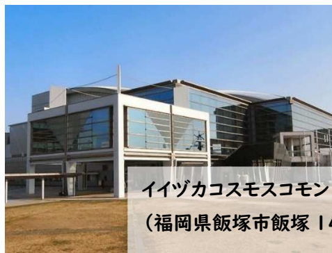
イヅカコスモスコモン 中ホール (福岡県飯塚市飯塚 14 番 66 号)